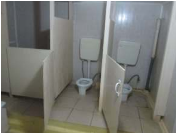
фото № 15