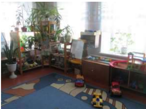
фото № 9