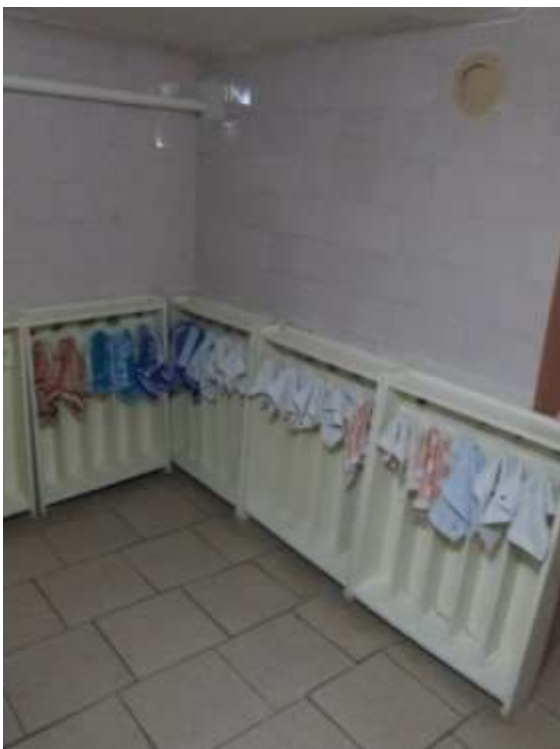
фото № 17