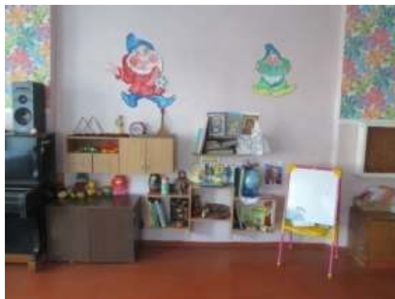
фото № 12