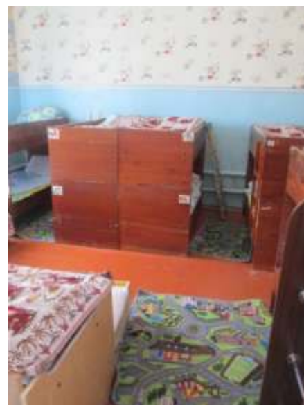
фото № 14