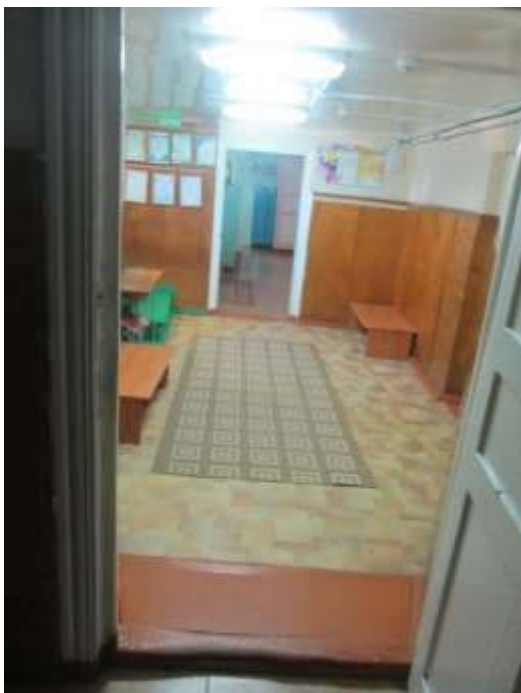
фото № 5