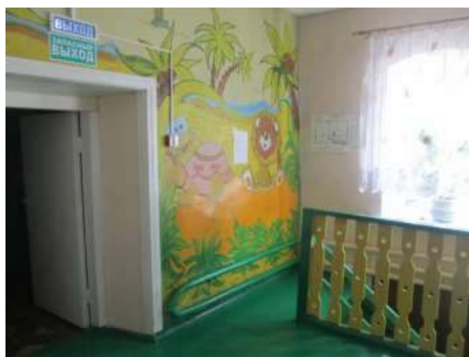
фото № 8