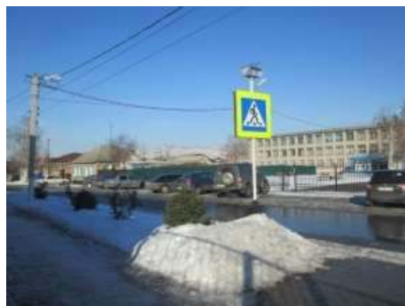
фото № 2