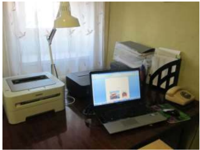
фото № 20