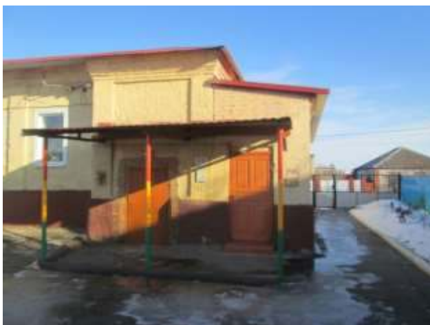
фото № 3