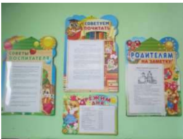
фото № 21