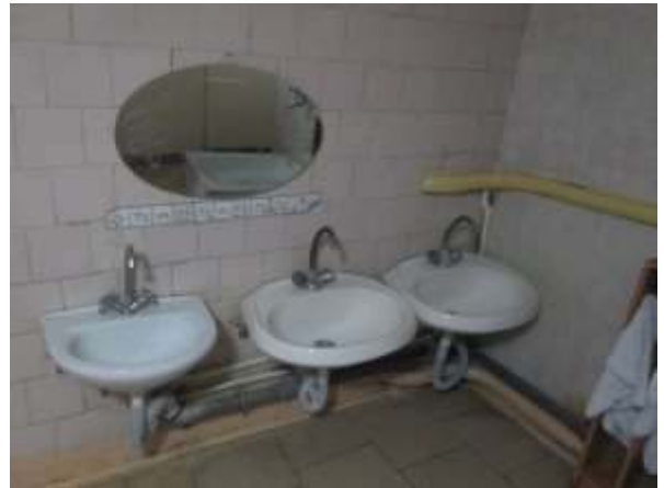
фото № 16