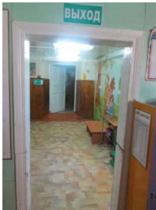
фото № 6