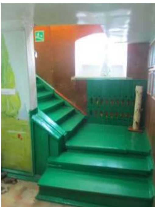
фото № 7