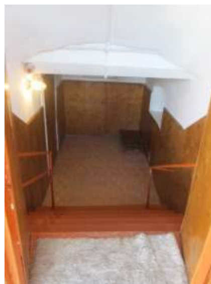
фото № 4