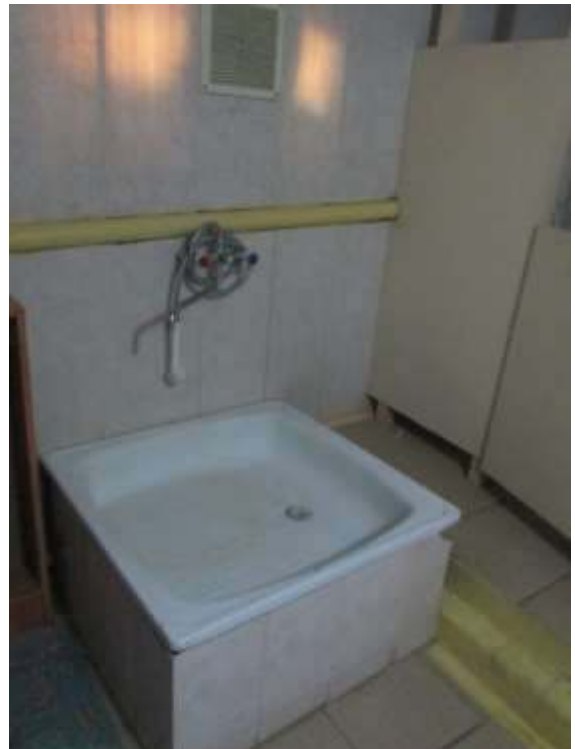
фото № 18