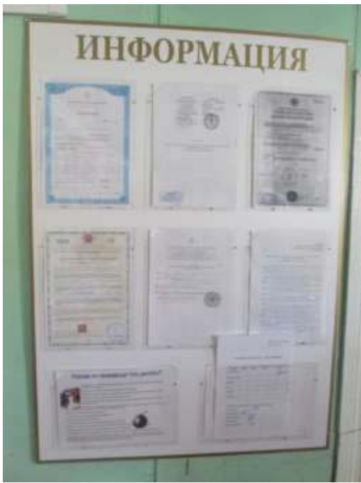
фото № 19