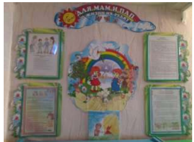
фото № 22