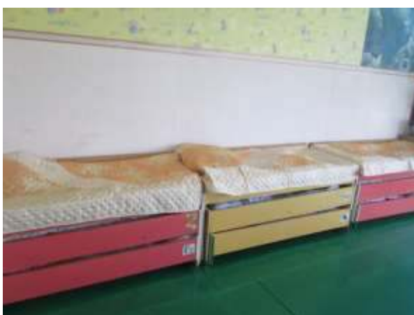
Фото № 13