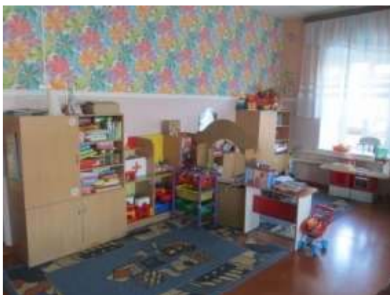
фото № 11